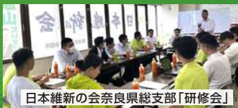
日本維新の会奈良県総支部「研修会」

奈良県議会の6月定例会において、維新会派は、身を切る改革として議員報酬を20%削減する条例改正案を提案しましたが、自民党などの反対多数で否決されました。日本維新の会奈良県総支部は、これまで同様、議員報酬の一部を被災地などに寄附していく方針です。